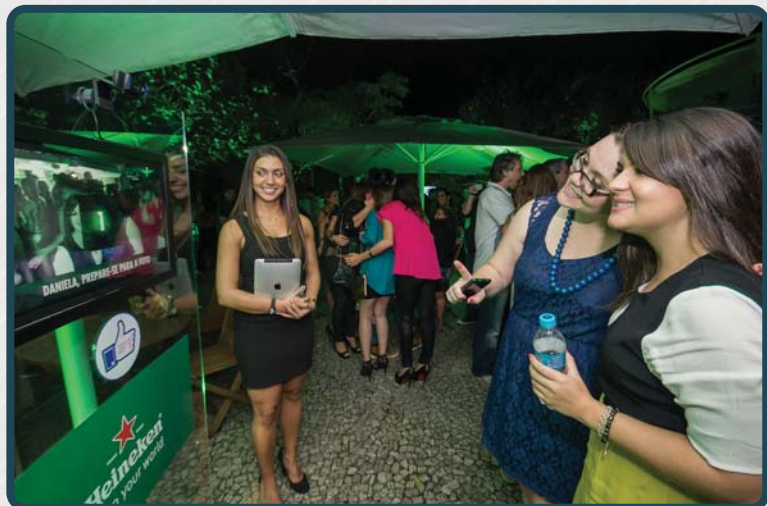
Portabilidade, Facilidade e Sutileza Visual