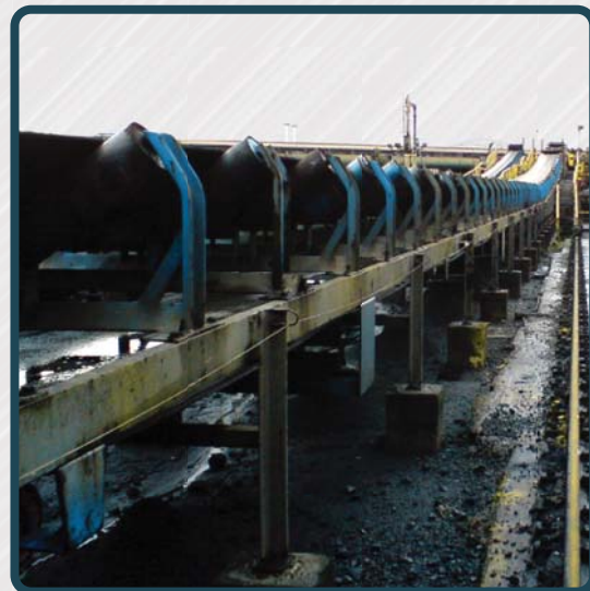
Rastreo de Máquinas